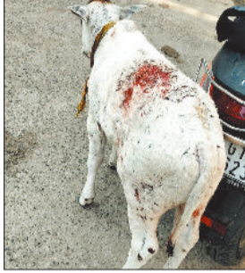
कुत्तों ने बछड़े पर किया हमला।

स्थानीय लोगों के अनुसार कुत्तों का यह झुंड न केवल लोगों को डराता है, बल्कि बिल्लियों, बकरियों और गाय के बछड़ों पर भी हमला कर रहा है। हालात ऐसे हैं कि कॉलोनी के बच्चे डर के कारण घर से बाहर निकलकर खेलने तक नहीं जा पा रहे हैं। शनिवार सुबह एक बार फिर कुत्तों के झुंड ने एक बछड़े को निशाना बनाया और करीब 10-12 कुत्तों ने उसे बुरी तरह नोच डाला, जिससे वह गंभीर रूप से घायल हो गया। मौके पर मौजूद रहवासियों ने