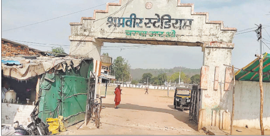
श्रमवीर स्टेडियम का प्रवेश द्वार।

घटना के बाद आसपास के लोगों में भय और आक्रोश दोनों देखने को मिला। करीब 50 साल पुराने इस स्टेडियम का प्रवेश द्वार लंबे समय से जर्जर स्थिति में है, लेकिन इसके बावजूद एसईसीएल प्रबंधन ने अब तक इसकी मरम्मत को लेकर कोई ठोस कदम नहीं उठाया है। स्थानीय लोगों का कहना है कि कई बार इस ओर ध्यान